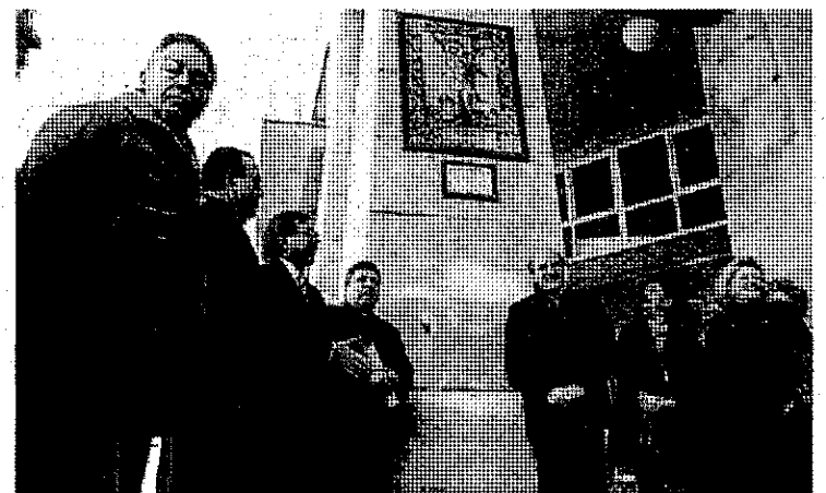
El azulejo de San Sebastián fue inaugurado ayer.